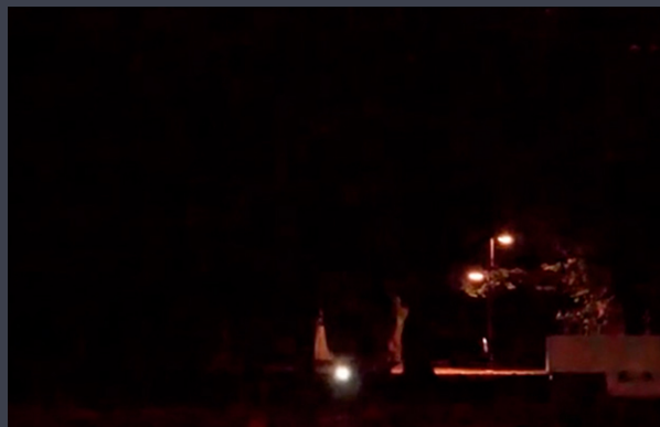
比較①市販のビデオカメラで撮影(20時の公園)