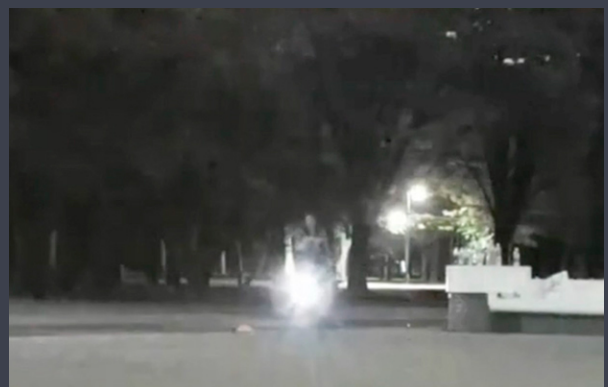
比較②MW10 HiKARIで撮影(20時の公園)